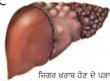
ਜਿਗਰ ਖ਼ਰਾਬ ਹੋਣ ਦੇ ਪੜਾਅ